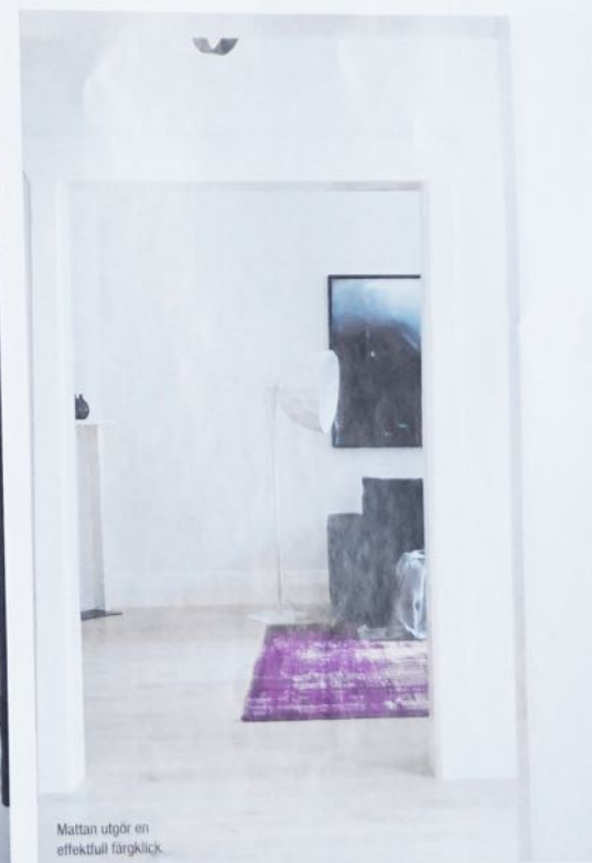
Mattan utgör en effektiv färgklick.