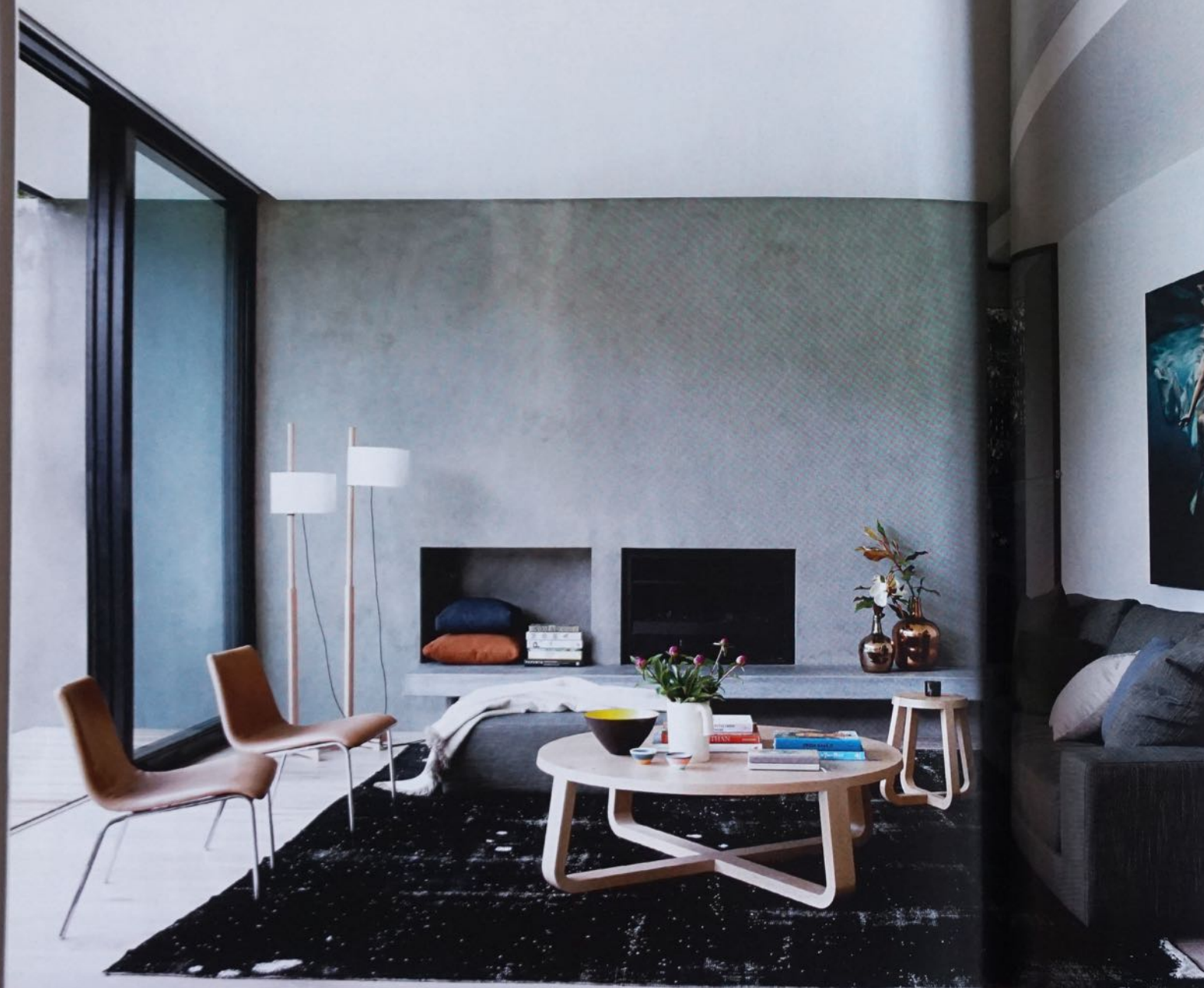
Nya sociala ytor vetter ut mot trädgården.