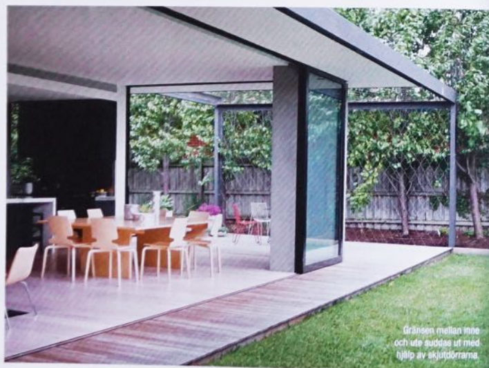
Gränsen mellan inne och ute suddas ut med hjälp av skjutdörrarna.

– Den är supernöjd och har berättat att man trots en någon negativ inställning till renoveringar och ombyggnationer, fått ett nytt perspektiv efter det här bygget. Huset har blivit exakt så socialt inbjudande som efterfrågades och utan att slä mig för bröstet förstår jag verkligen att familjen trivs. ■