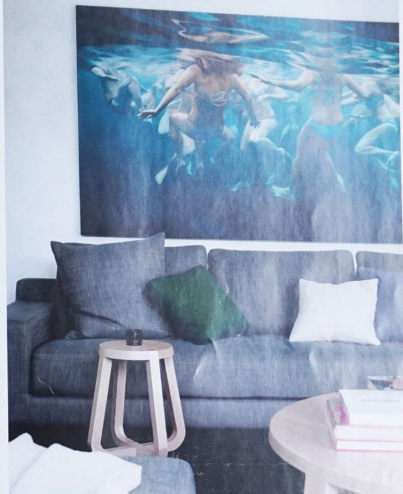
Genomgående ljus och grått i vardagsrummet.