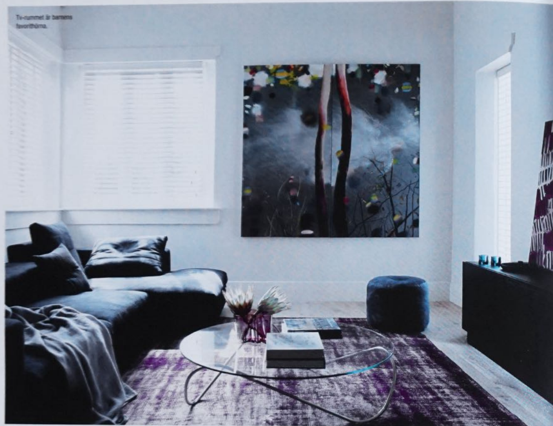
Tv-rummet är barnens favoritrum.