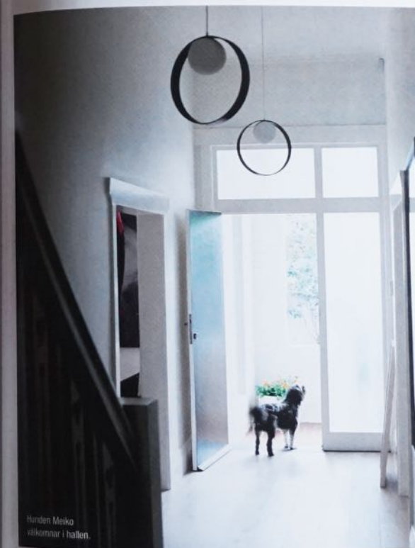
Hunden Meiko välkomnar i hallen.