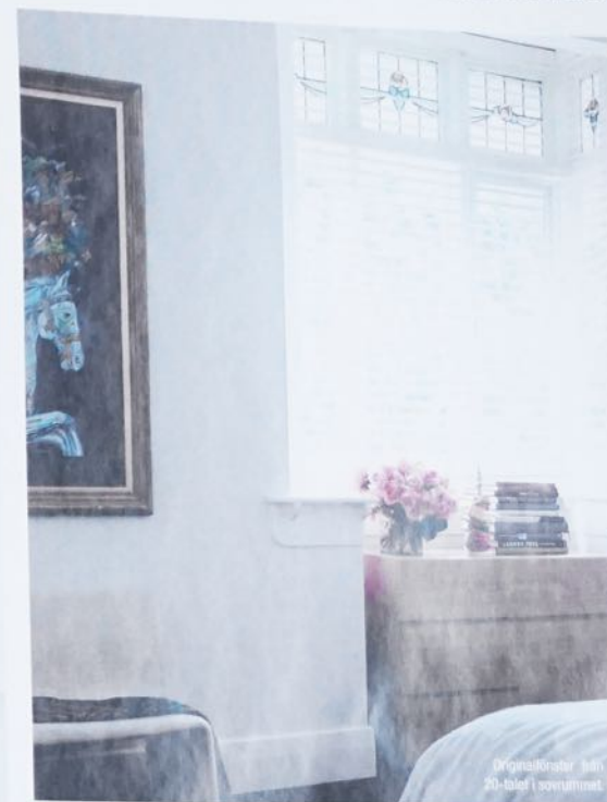
Originalkrokar från 20-talet i sovrummet.